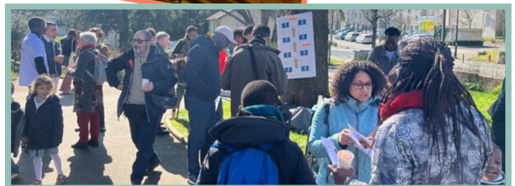
Pot et vente des étudiants après la messe unique pour le jubilé à Rome

Merci aux donateurs! La collecte continue jusqu'à Pâques