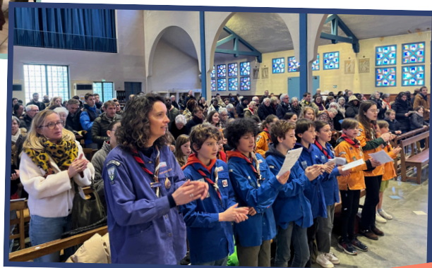
Messe animée par les scouts