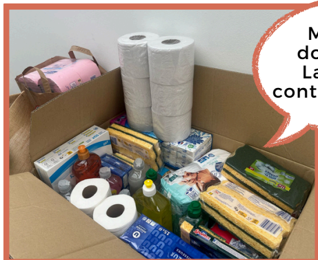
Collecte pour l'association l'Abri des familles

Merci aux donateurs! La collecte continue jusqu'à Pâques