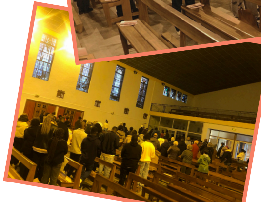
Chemin de Croix animé par les étudiants