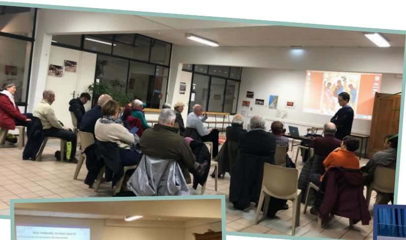
Topo "Le Carême pour tous"