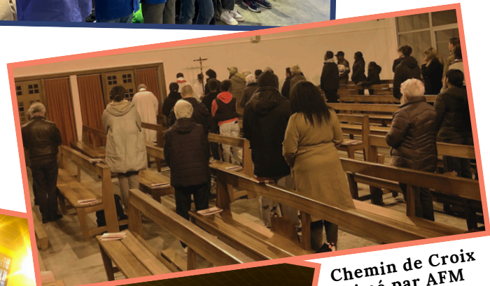
Chemin de Croix animé par AFM

Pour recevoir la lanterne chez vous, inscrivez-vous à la maison paroissiale!