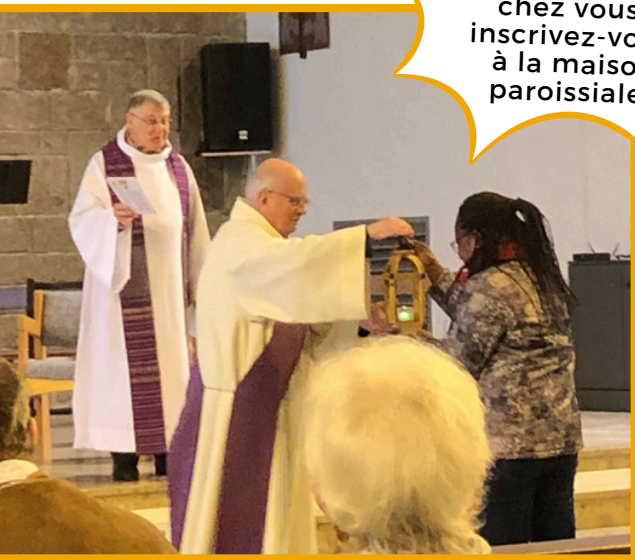
Transmission de la lanterne du Jubilé

Pour recevoir la lanterne chez vous, inscrivez-vous à la maison paroissiale!