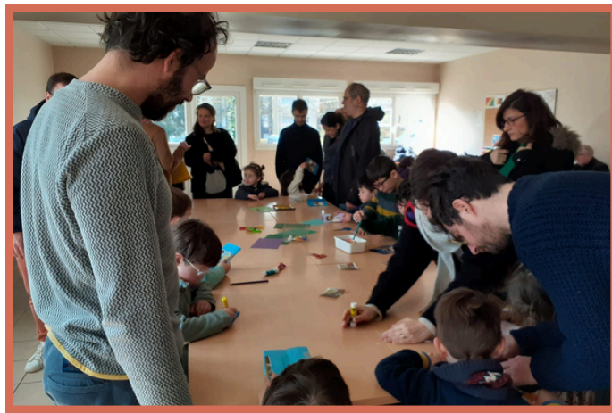
Eveil à la foi, pour les enfants "Fais confiance à Jésus"